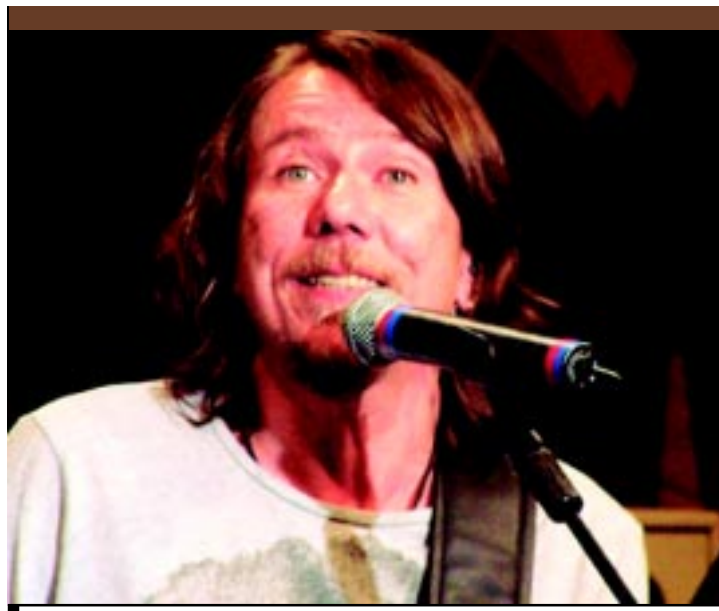
O pernambucano Lenine se apresenta no Ponto de Cem Réis, no Centro

O "Verão em Ação", que tem início no dia 11 de janeiro e termina em 12 de fevereiro, constará de escolinhas de quarta à sexta-feira e prática livre para turistas e a população aos sábados e domingos. "Cada quadra ou espaço em que haverá a prática será coordenado por professores da área, para que tudo transcorra bem.