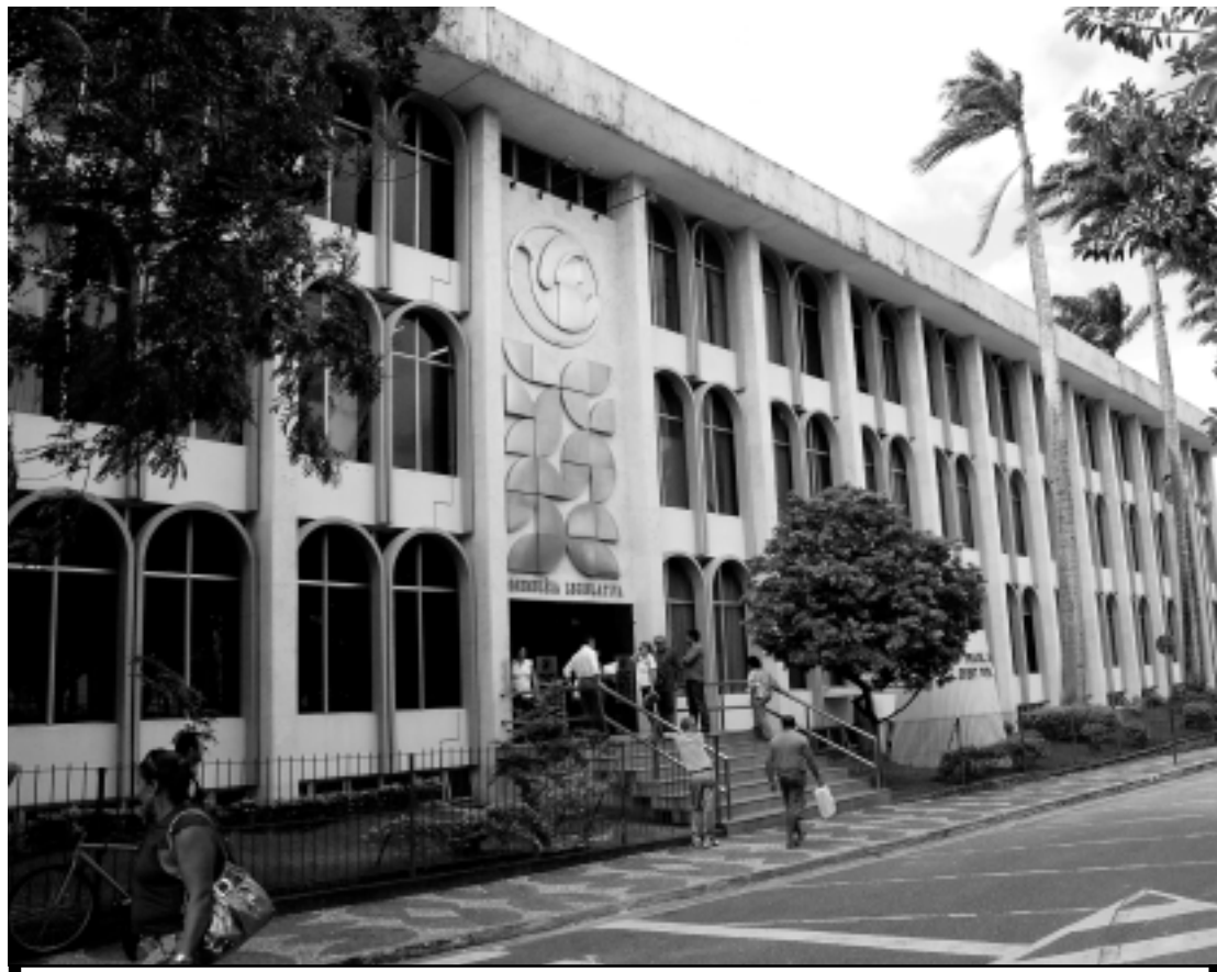
Ainda na tarde de ontem, o Plenário recebeu um novo parlamentar: Mikika (PSL) que assume a vaga de Tião Gomes

Os números totais de 2011, também de acordo com a RFB, podem alcançar os R$ 67 bilhões, valor 14,7% maior que o acumulado em todo o ano de 2010.