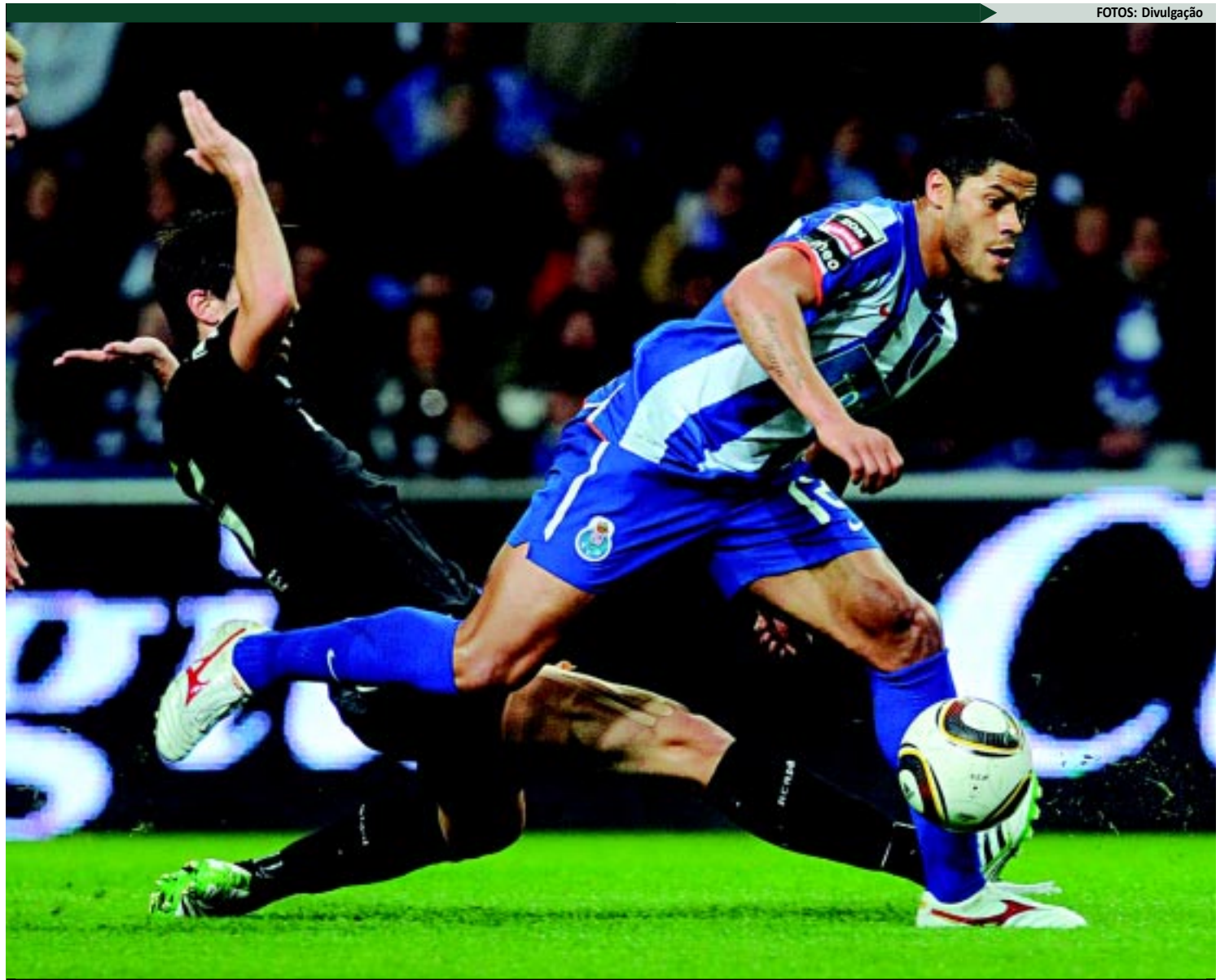
O atacante Hulk, que é de Campina Grande, vem fazendo sucesso jogando pelo Porto e já foi convocado este ano para defender a Seleção Brasileira

As festas de Natal e Ano Novo não vão alterar o planejamento do Botafogo nos preparativos para o Campeonato Paraibano de 2012.