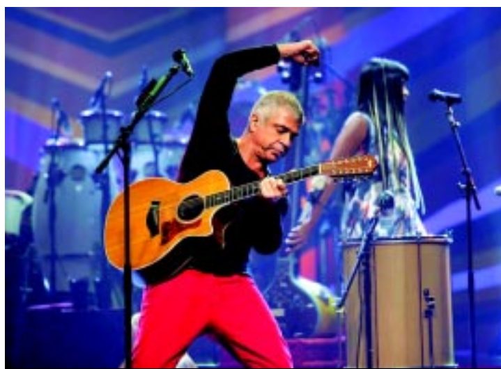
Lulu Santos volta a João Pessoa para animar a festa na Praia de Tambaú