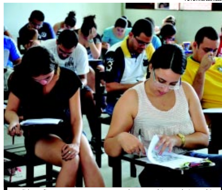
Candidatos fizeram, entre outras, provas de Matemática, Química e Física

lizada nos dias 20 e 21 de novembro, relativas aos conteúdos de Língua Portuguesa e Literatura Brasileira, Matemática, Química, Física e Biologia da 1ª e da 2ª série do Ensino Médio, de acordo com a Coperve, 55.577 foram eliminados por falta e 118 por usarem aparelhos de telefone celular durante o processo. Ainda foram desclassificados 194 por nota zero e 5.008 por não terem atingido um desempenho mínimo de 15% do total de pontos em uma das áreas de conhecimento à qual se submeteram.