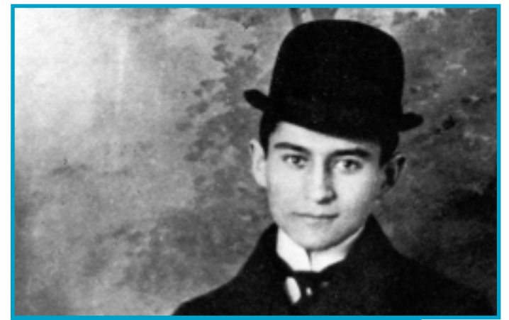
O PROCESSO, DE KAFKA, AGORA EM QUADRINHOS

# O filme de aventura Sherlock Holmes: O Jogo de Sombras liderou um trio de sequências nas bilheterias americanas, com US$ 40 milhões em vendas de ingressos, de acordo com estimativas dos estúdios compiladas pela Reuters. A sequência do filme de 2009 Sherlock Holmes , estrelado por Robert Downey Jr., ganhou de Alvin e os Esquilos 3 , o terceiro filme da popular série voltada para a família. Missão Impossível: Protocolo Fantasma , o quarto filme da série de ação estrelada por Tom Cruise, ficou em terceiro lugar.