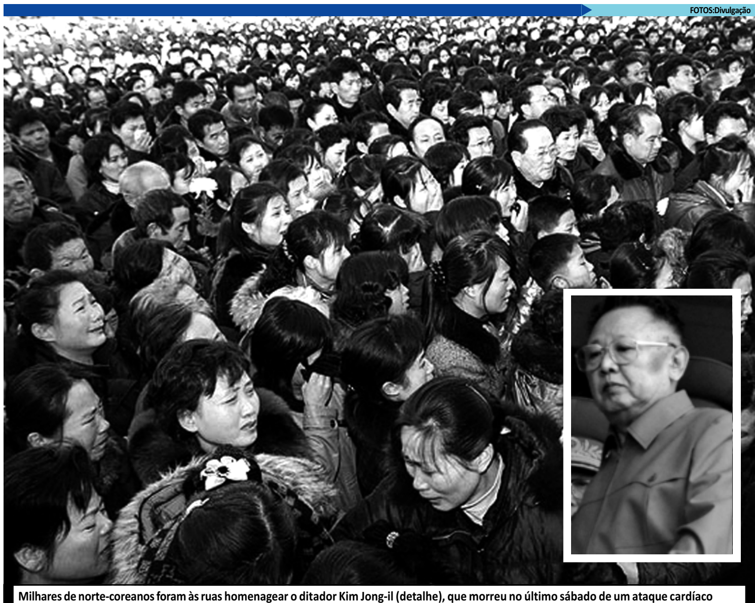
Milhares de norte-coreanos foram às ruas homenagear o ditador Kim Jong-il (detalhe), que morreu no último sábado de um ataque cardíaco

O anúncio da morte do norte-coreano fez com que o primeiro ministro japonês, Yoshihiko Noda, cancelasse um discurso já marcado e re-