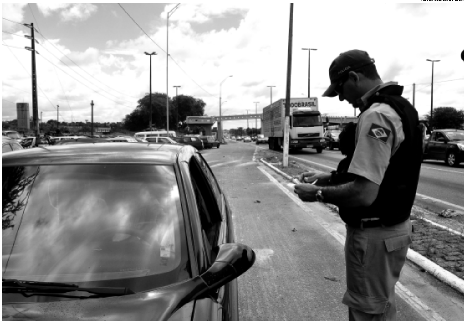
A Polícia Rodoviária Federal vai intensificar a fiscalização nas estradas, com foco principal na abordagem a motoristas que ingerirem bebidas alcoólicas

O índice de gravidade é baseado em estudo do Instituto de Pesquisa Econômica Aplicada (Ipea), que define pesos para os acidentes da seguinte maneira: acidente sem vítima (1 ponto), acidente com vítima (5 pontos) e acidente com óbito (25 pontos). Para calcular o Índice de Gravidade, multiplica-se o número de acidentes registrados no trecho pela pontuação de cada tipo. O somatório final é o índice de gravidade.