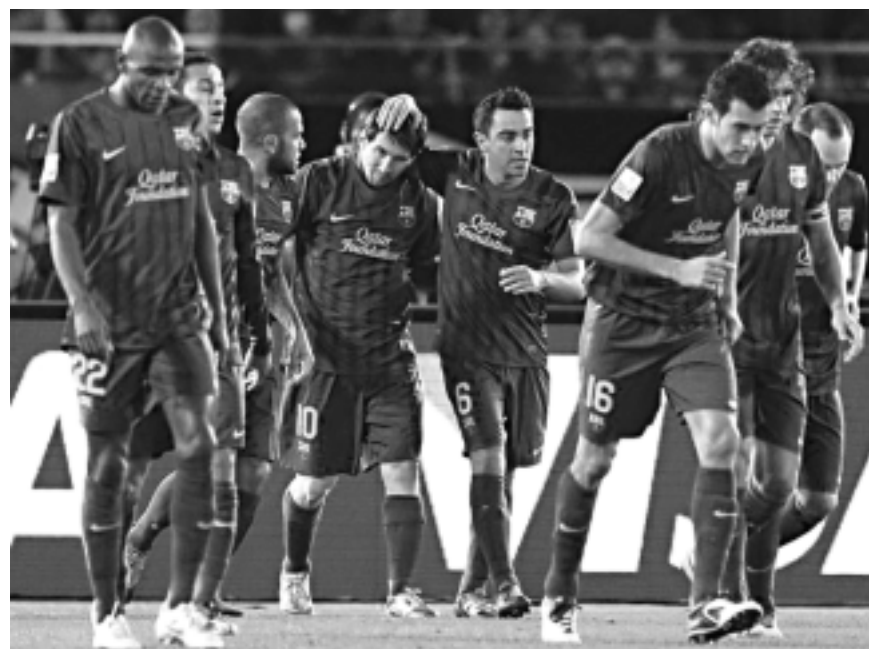
O camisa 10 do Barcelona é cumprimentado pelos companheiros após o primeiro gol

"Tomara que a gente continue dessa maneira. Agora é férias e depois