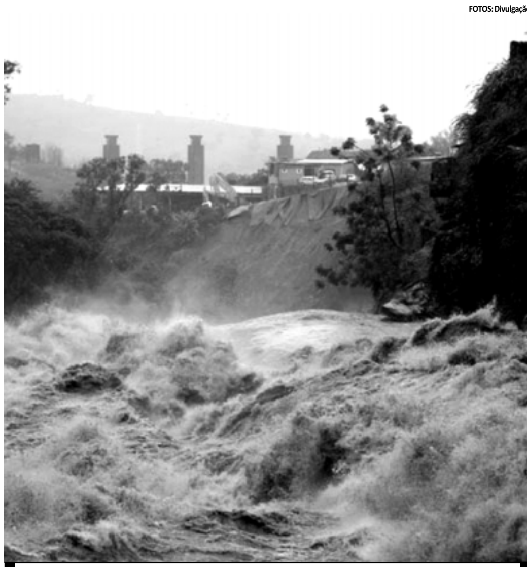
Temporal elevou o nível do rio Arrudas, próximo ao bairro Granja de Freitas, na capital mineira