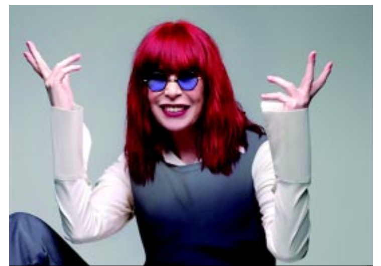
A irreverente Rita Lee anima o réveillon, ao lado de Antônio Nóbrega