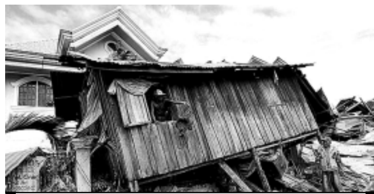
Na cidade de Iligan, moradores retiraram pertences de casa destruída

A imprensa local e parte da população culpam o governo