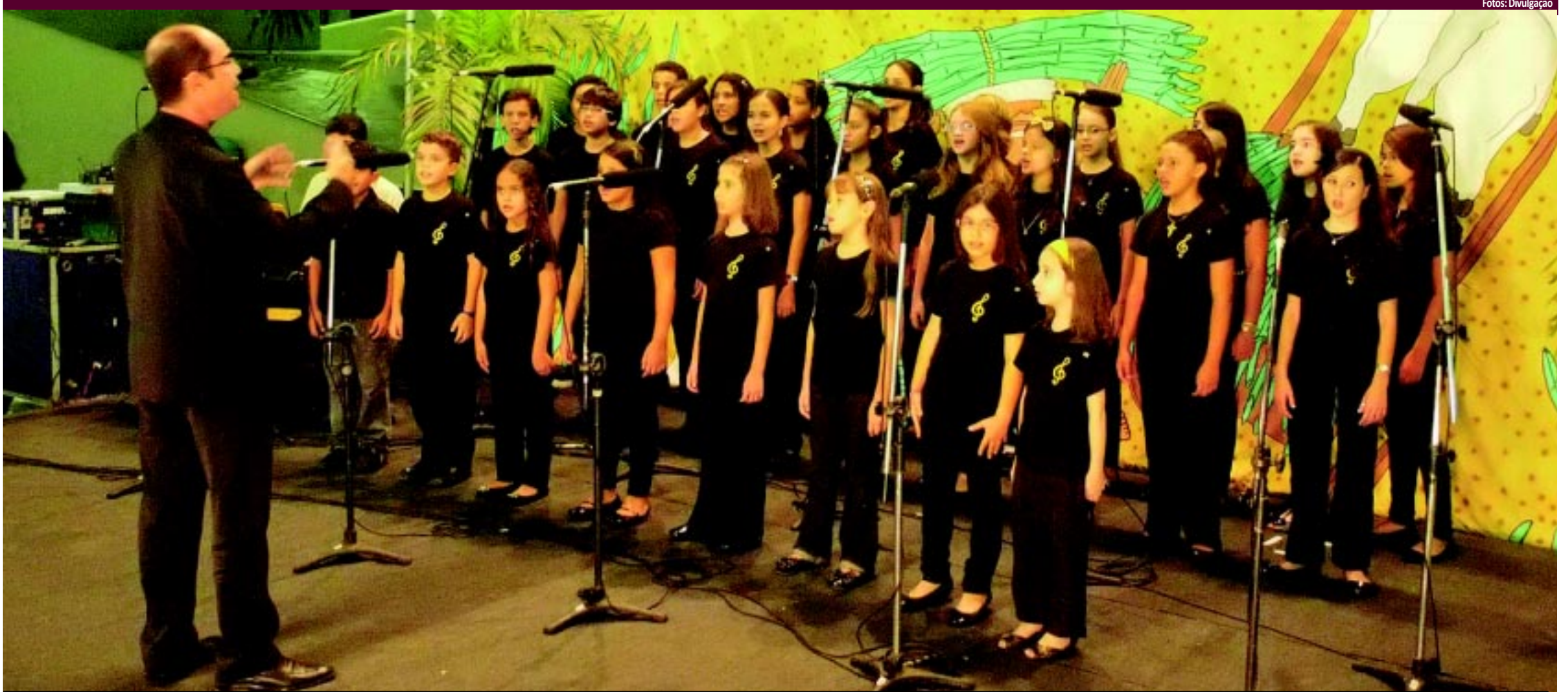
Os músicos do Quinteto Brassil vão acompanhar o Coral Sinfônico Infantil da Paraíba na execução de músicas como 'Adeste, Fideles', tendo como palco a Praça João Pessoa, no Centro da Capital

Evento é aberto ao público e terá como palcos a sede do Governo Estadual e a Praça João Pessoa