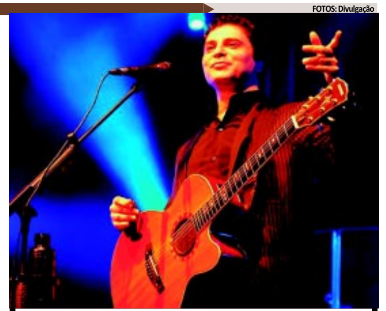
A voz inconfundível de Frejat vai dar o tom no dia 28 de janeiro, na orla