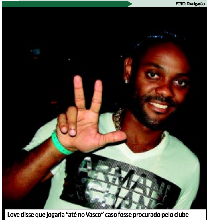
Love disse que jogaria “até no Vasco” caso fosse procurado pelo clube