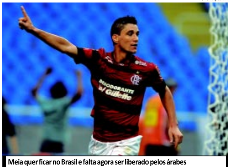
Meia quer ficar no Brasil e falta agora ser liberado pelos árabes