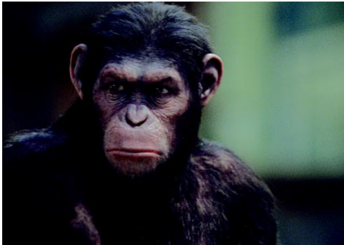
O ator Andy Serkis interpretou o macaco Cesar, mas, pela interação digital da atuação, não deve ganhar Oscar

A grande revolução do digital já vinha se