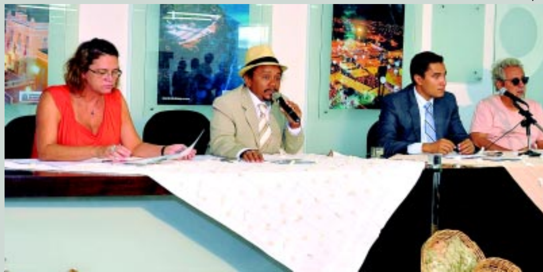
Projeto será realizado pelo Governo do Estado e as prefeituras de JP, Conde, Cabedelo, Lucena e Baía da Traição