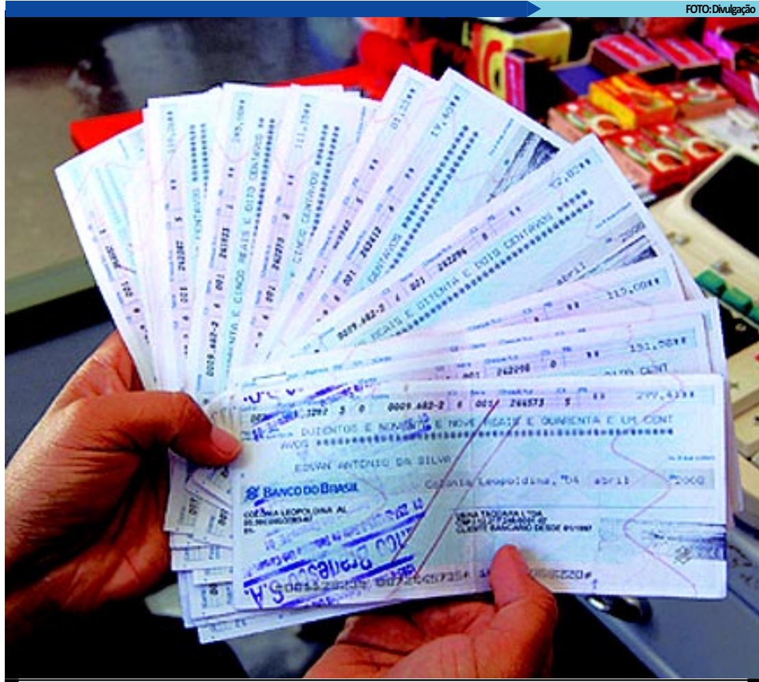
Cheques devolvidos refletem as compras parceladas feitas com pré-datado no Dia das Crianças, conforme a Serasa

De janeiro a novembro, Roraima foi o Estado com o maior percentual de che-