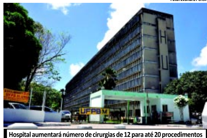
Hospital aumentará número de cirurgias de 12 para até 20 procedimentos

O MDA entregará seis bibliotecas rurais para comunidades do campo na cidade de Dona Inês, no Agreste paraibano. PÁGINA 21