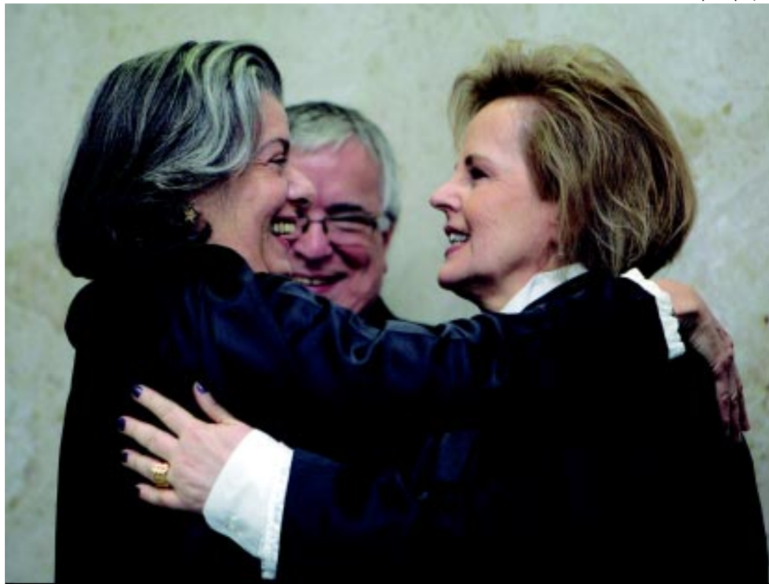
Ministra Carmem Lúcia cumprimenta Rosa Weber, que deixa a Corte completa e apta a julgar casos de repercussão

O presidente da Comissão Mista de Orçamento, informou que o parecer de Chinaglia deverá ser votado amanhã na comissão e na quinta-feira no plenário do Congresso Nacional. Ele informou, também, que hoje o Congresso Nacional (Câmara e Senado) deverá votar o Plano Plurianual (PPA) 2012-2015.