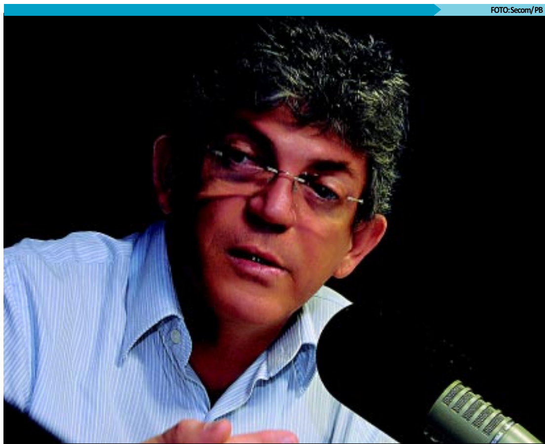
Governador garantiu que profissionais da Educação terão o maior aumento salarial variando de 10% a 33%

Além do reajuste na folha de pagamentos, o Governo da Paraíba passa a pagar o salário mínimo como vencimento básico, mais popularmente conhecido como "cabeça do contracheque", saindo dos atuais R$ 545 para R$ 622,73. Esta foi, durante o ano, uma das maiores reivindicações do conjunto dos servidores públicos. Também será mantido o auxílio-alimentação instituído por Ricardo Coutinho, no valor de 10%, para quem ganha R$ 600.