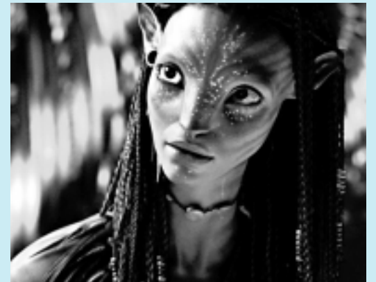
Cena do longa-metragem Avatar, de James Cameron

>>> AVATAR - Jake Sully ficou paraplégico após um combate na Terra. Selecionado para participar do programa Avatar, ele viaja a Pandora lar de seres humanóides chamados Na'vi. Os humanos desejam explorar Pandora, mas como são incapazes de respirar o ar do local, criam seres híbridos chamados de Avatar, controlados por seres humanos, através de uma tecnologia que permite que seus pensamentos sejam aplicados no corpo do Avatar. SE LIGUE: Hoje, às 22h, no Telecine Action