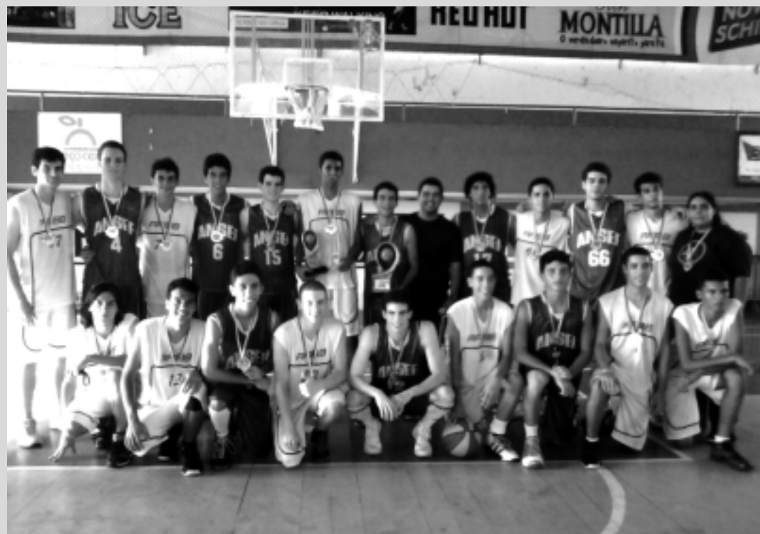
A equipe do Ansef/Corpore derrotou o time da AABB/CG e conquistou o campeonato na categoria Sub-19