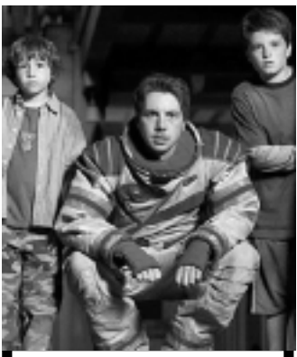
Zathura: Uma Aventura Espacial